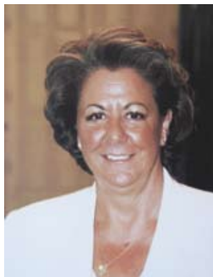
Rita Barberá Nolla Alcaldesa de Valencia